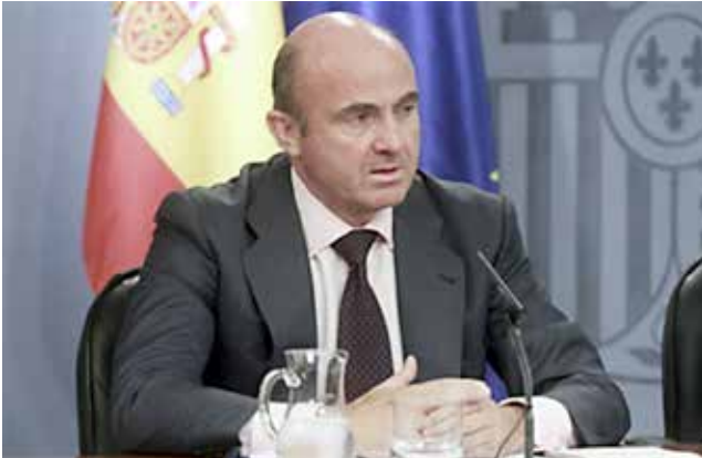
Luis de Guindos, Ministro de Economía.

- La renuncia al régimen especial del IVA de caja es voluntario, sin embargo la vinculación permanece durante tres años . La baja al régimen especial se podrá efectuar cada año en los meses de diciembre. Igualmente, quien renuncie a ese criterio no podrá acogerse a él hasta dentro de tres años.