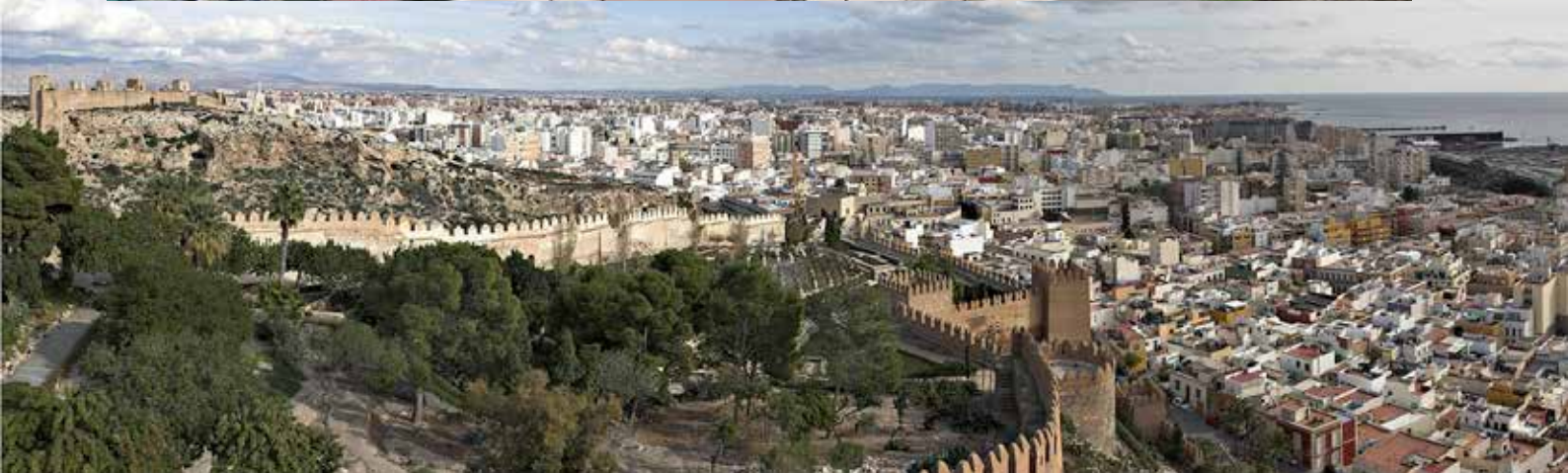
En la foto superior, el Campello (Alicante) y Almería, foto inferior, pueden aplicar una rebaja del 27% en sus valores catastrales este año.