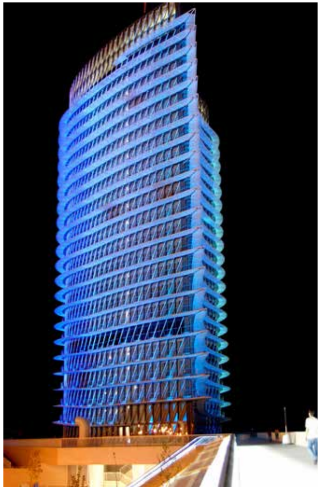
El edificio de la Torre del Agua es uno de los emblemas de la Zaragoza del siglo XXI.

(Para más información, contactar con la sede de la Asociación: 93 317 0809 ext.1)