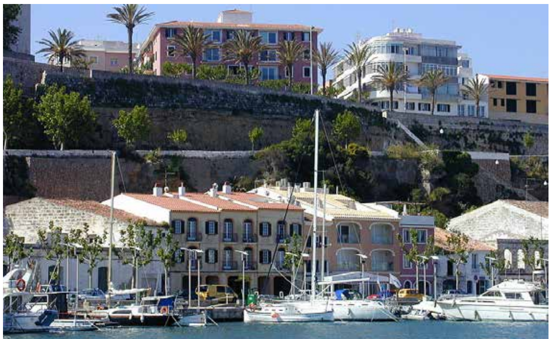
Imagen del Puerto de Mahón, uno de los lugares más emblemáticos y bellos de la capital de Menorca.

“Es, sobre todo, público nacional. Los británicos gestionan sus reservas a través de tour operadores y