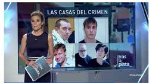
Tras La Pista | 2016/07/27