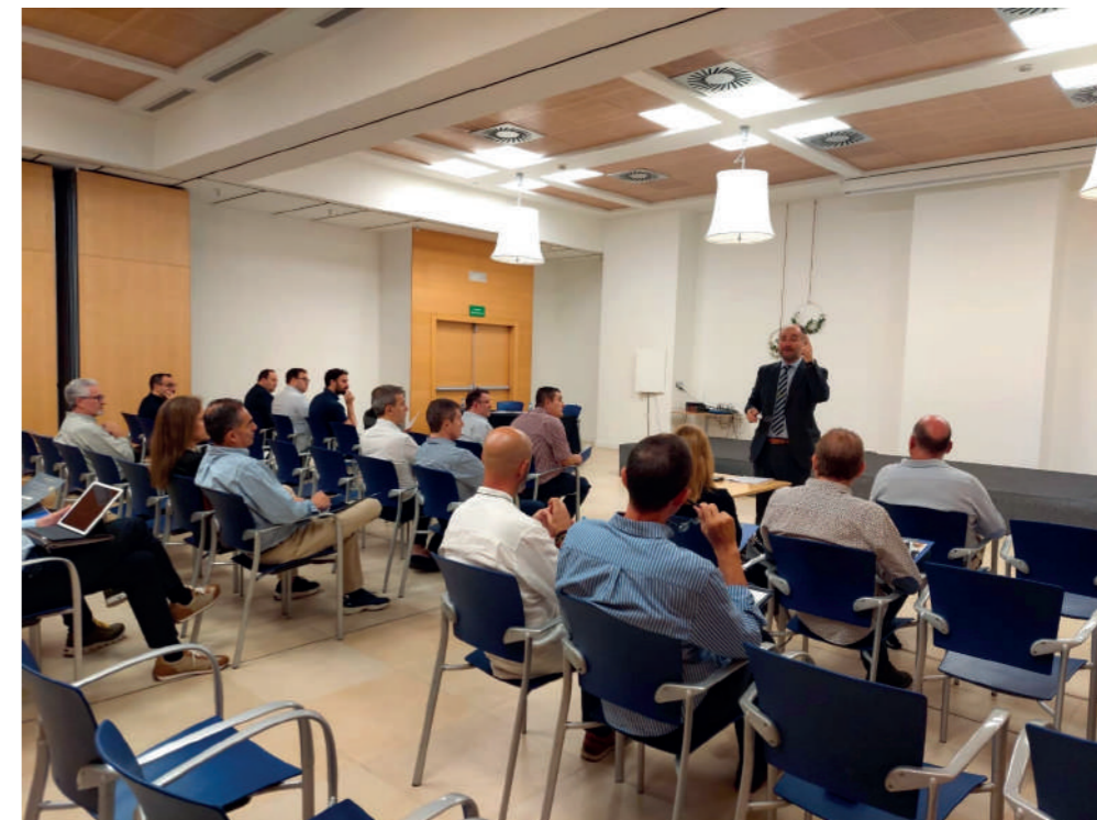
Sobre estas líneas, imagen de la sesión celebrada en Valencia el día 6 de octubre. Debajo, una imagen de la charla en Alicante.