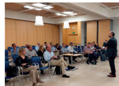
En la foto superior, otro de los momentos de la charla en Valencia