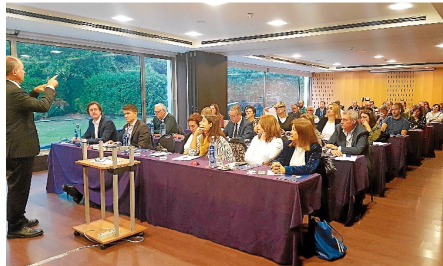
Mediadores inmobiliarios reunidos en el hotel NH Collection de Santiago.

por la Ley Hipotecaria, en vigor desde el 17 de junio, en especial el punto sobre los Intermediarios de Crédito Inmobiliario, uno de los aspectos que gran interés para estos profesionales. También se abordó la posible anulación del índice de referencia en los Préstamos Hipotecarios (IRPH) y el proyecto de decreto que modifica el procedimiento de certificación energética. J. CALVIÑO