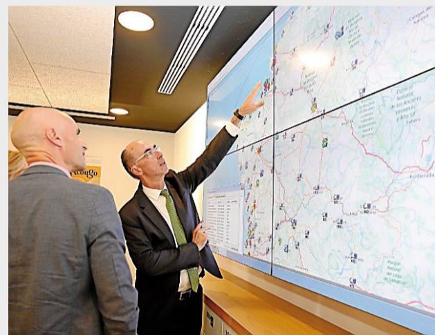
El conselleiro de Sanidade, Jesús Vázquez Almuiña, en una visita a la sede del 061 ante un mapa interactivo