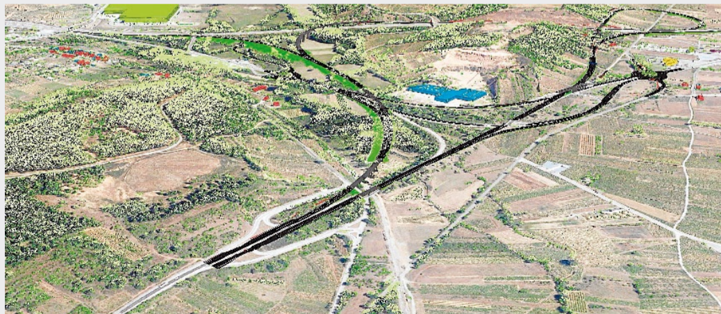
Vista de los planos digitales que sustituyen a los tradicionales que se emplearon de forma pionera por Ineco en Galicia en el proyecto de autovía A-76 que une Ponferrada con la ciudad de Ourense

Exprimen las iniciativas en clave gallega la nueva gran materia prima de este siglo XXI: los datos